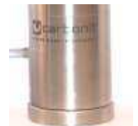
SANUNO inoxF mit Fuß

Weitere Informationen, Gutachten, Zertifikate und aktuelle Entwicklungen finden Sie im Internet unter www.carbonit.com / Mein Filter.