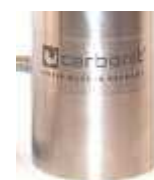
SANUNO inoxS Standard