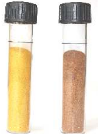
vor und nach der Kupferreduktion

Leistung die man sehen kann Färbung des KDF 55